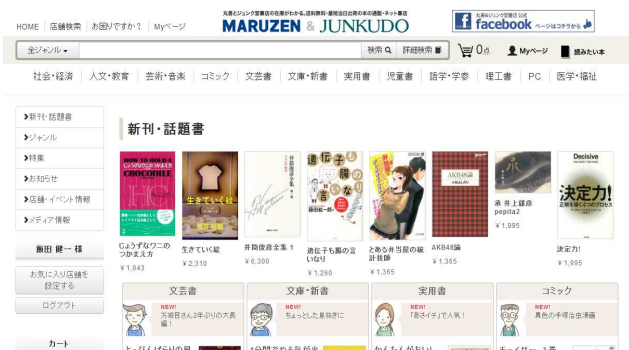
丸善&ジュンク堂ネットストアトップページ

また、小売のみならず、外商にも対応し、BtoC、BtoB ビジネスがひとつのシステム上で完結することでシステム運用の簡素化も実現。同時に、ジュンク堂台湾店のグローバル POS レジにエスキュービズムの「EC-Orange POS」を搭載することで、来年4月に予定されている Windows XP のサポート切れや、為替、言語といった EC 国際化の前に立ちはだかる障壁をすべて解決しながら、従来の基幹システム上での運用を可能としました。