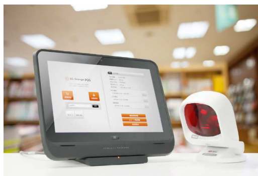
ジュンク堂台湾店に導入するタブレットPOSレジ

今回のケースをロールモデルとし、エスキュービズムは、同様の課題を抱える小売店様に対し、今後も積極的に働きかけ、最適なソリューションを提供し続けてまいります。